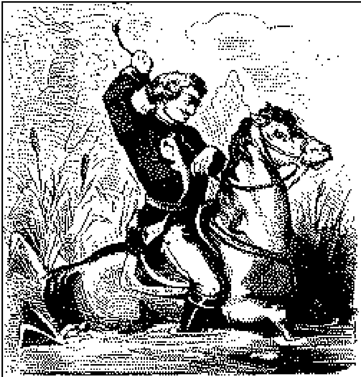
Baron von Münchhausen